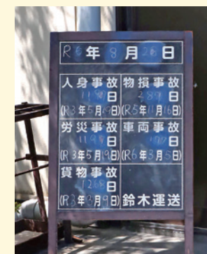
安全運転を願って 毎日記録されている看板

決まったお客様がいないのが特徴だとおっしゃっていたが、どんな案件でも対応できる幅広い対応力があるからこそ、幅広いお客様から高い評価を頂いているのだと思う。要望を受け入れ、どのようにすれば対応できるのかを考え、運搬するという一連の行動を何人もの熟練スタッフが携わってこなしていく。大手運輸企業に引けを取らないシステムチックな情報処理が優秀なスタッフによって練り広げられており、その中には熱い思いが込められていることが強く感じられる。