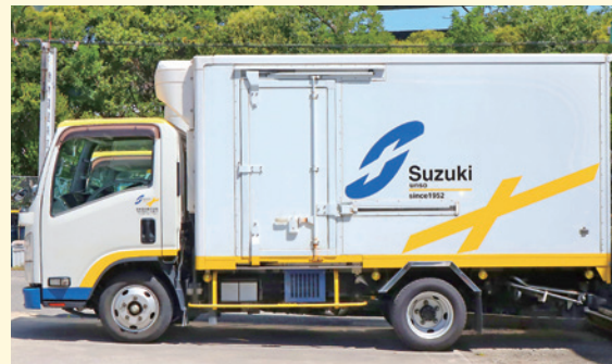
鈴木運送のロゴマークが配されたトラック

の替えがない。また、急ぎで指定の場所に運搬しなくてはならないことも多い。精密で高額な設備機器の運搬を任されるのは、信頼関係が築かれているからだ。クライアントのニーズに寄り添い、サービスの進化を常に追求している。