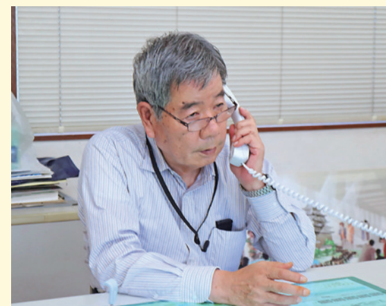
社員との信頼関係が大切と語る社長

今後、ますます厳しくなる運輸業界。しかし、信念を持って丁寧な仕事を続けていきたいと社長は語る。無理のない配車スケジュールを心がけることでドライバーの負担を軽減し、結果、勤務歴の長いドライバーが多いことも心強い。配車手配や商品の管理は社内のスタッフが担当しており、クライアントとの付き合いが長いため、物流の仕組みや商品による搬送先の違いをお客様の担当者以上に理解していることもある。積み重ねてきた信用と信頼を大切にしながら、今後もきめ細やかな対応の価値を理解してくれるお客様と長くお付き合いすることで、運輸業を取り巻く様々な問題も一つずつクリアしていけると信じている。