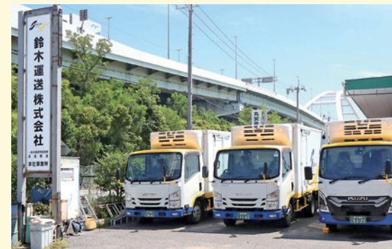
西宮浜の交通至便な場所にある本社

ドライバーや社員に常に伝えているのは、「お客様は何を望んでいるのかを常に考えた運転行動を取ってほしい」ということ。例えば、荷崩れ厳禁を指示されるお客様や、細かな要望に確実に応えることを期待するお客様がいる。商品によっては似通っていて判別しにくいものもあり、荷物を届けた後のクライアントの利便性を考え、ラベリングを施すこともある。これらの対応は、研修やマニュアルを通じてではなく、勤続年数が長いドライバーたちが日々の仕