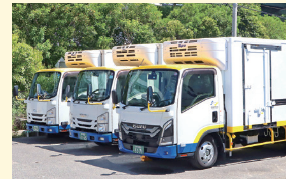
お客様の需要により冷蔵車の保有率が高い

兵庫県交通共済との関係は、1971年から続いている。最初はトラック1台から始まった関係が、今では「事故処理の速さや過失割合に対する適切な対応など、満足のいくものであり、信頼できるパートナーである」との評価をいただくまでに至っている。