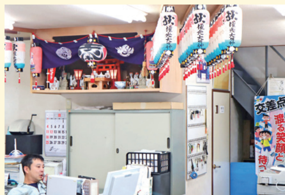
お客様の要望に的確に対応する事務所

一方、電気設備機器を取り扱うメーカーとの取引では、迅速かつ確実な運搬が求められる。専用に作られた設備機器であるため、壊れた際