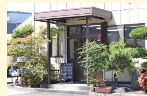
鈴木運送株式会社 (西宮市西宮浜2-6-3)