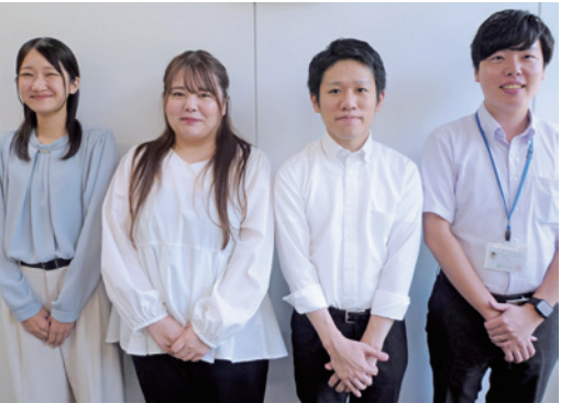
左より 堀内職員 石飛職員 岡田職員 堤職員